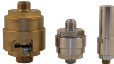
Tipo AHF 03/04/05

Materias: latón, latón cromado o inox Juntas: NBR