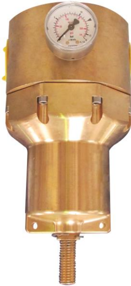
Débits (AIR) / Flows rates (AIR)