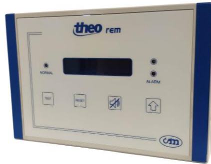
Maître / Report intelligent Master / Intelligent remote