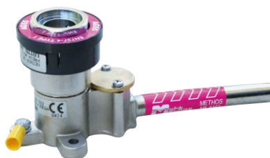
Tête de lit / bed head unit (vide / vacuum)